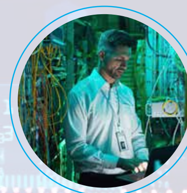
Ingenieros de soporte