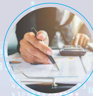
Gerente de proyectos

Sin importar el tamaño de tu empresa, existen perfiles de Ingenieros que ayudan a dar solución a tu necesidad, entre ellos tenemos: